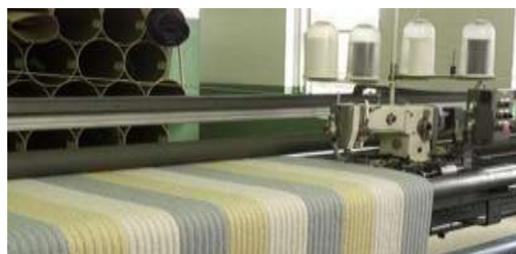
Imagen 4. Abiertos a un futuro prometedor con Syteline ERP

El sistema de escaneo portátil, parte de la solución Data Collection de Syteline ERP que también implementó CMI, permite a la empresa a acelerar los movimientos de materiales entre los distintos centros de trabajo.