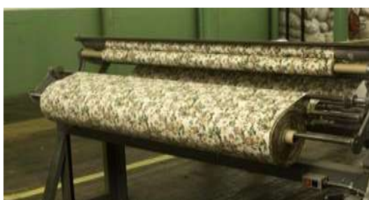
Imagen 3. Un ERP orientado a los negocios

Turgeon comenta también que el nuevo sistema ERP le ahorra muchas horas de trabajo cada mes. “Anteriormente, pasaba de cuatro a diez horas a la semana escribiendo “queries” solicitados especialmente. Ahora gracias a la base de datos de Syteline ERP sólo necesito una o dos horas para escribirlos, lo que me permite más tiempo para dedicarme a las actividades estratégicas, mucho más valiosas para la compañía. ”