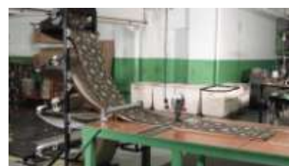
Imagen 2. Estrategia ERP de la empresa

Concluida la capacitación y una vez implementado Infor ERP Syteline, - lo que sucedió en un plazo razonable - y que todos los usuarios empezaron a seguir los procedimientos establecidos durante los talleres ERP, se vieron de inmediato mejoras operativas en CMI subraya Turgeon, “Las dos medidas más importantes en la determinación del bienestar de nuestro negocio son: el porcentaje de entregas a tiempo y el número de días desde el momento de recepción de un Pedido de Cliente en el ERP hasta el momento en que sale embarcado.