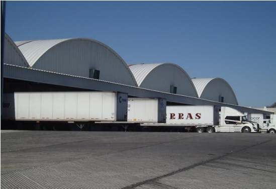
Imagen 1. ERP en Empacadora San Marcos