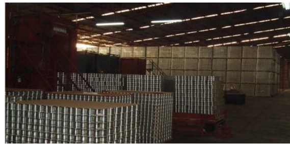
Imagen 4. Un ERP que refleja resultados