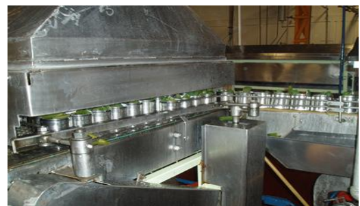
Imagen 2. Estrategia ERP específica para la empresa

Después de una extensa y profunda investigación junto con la evaluación del proceso del ERP y sus aplicaciones, Empacadora San Marcos seleccionó Infor ERP XA para lograr su visión y sus objetivos. San Marcos está utilizando la soluciones Infor para mejorar sus procesos y ser una empresa más rentable de un Pedido de Cliente en el ERP hasta el momento en que sale embarcado.