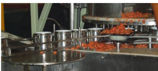
Imagen 3. Implementando una solución ERP

Otro beneficio que se ha obtenido gracias a la implementación es que ha logrado mejorar los procesos haciéndolos más eficientes lo que les ha facilitado el cumplimiento de los estándares de la normas de calidad gestionadas por el ERP y esto les ha abierto las puertas para exportar sus productos, convirtiéndose en el mayor exportador de productos envasados de México.